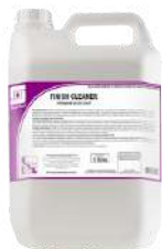
FINISH CLEANER Detergente limpador para limpeza e manutenção de pisos com acabamentos acrílicos