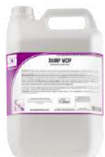
DAMP MOP Detergente de uso diário para limpeza de pisos