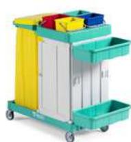
MAGIC LINE 310 S SAFETY

O uso de equipamentos como carrinhos funcionais adequados pode reduzir significativamente o índice de afastamentos por lesões e esforço repetitivo no ambiente hospitalar, com estudos indicando uma redução de até 50%* nos casos de afastamento relacionados a esses fatores. Esses equipamentos ajudam a minimizar o esforço físico, melhoram a ergonomia, e promovem a segurança dos trabalhadores, prevenindo lesões musculoesqueléticas e diminuindo a necessidade de movimentos repetitivos, que são as principais causas de afastamento *Fonte Scielo