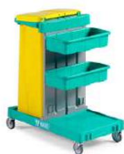
MAGIC LINE 111B BASIC