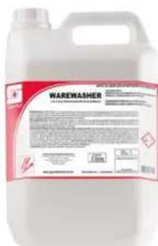
WARE WASHER Detergente Alcalino para máquina de lavar louças