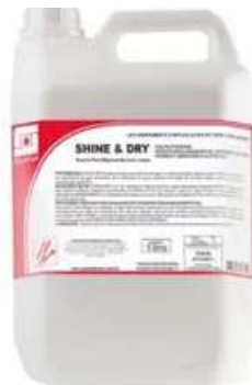
Shine & Dry Secante para máquina de lavar louças