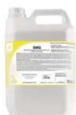
DMQ Desinfetante Hospitalar