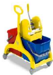
BALDE ESPREMEDOR NICK DUPLO AMARELO