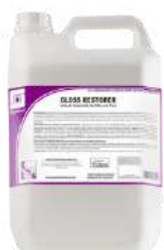
GLASS RESTORER Limpador restaurador de brilho para acabamentos high e ultra high speed