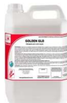
Golden Glo Detergente Neutro Concentrado