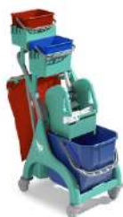
NICK PLUS 30