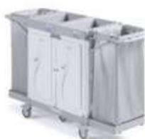
MAGIC HOTEL 850 S