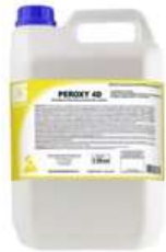
PEROXY 4D Detergente Desinfetante para Limpeza Hospitalar