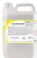
FLOOR FINISH Removedor de ceras e acabamentos seladores