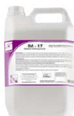
DA-17 Detergente de baixa espumação para limpeza pesada