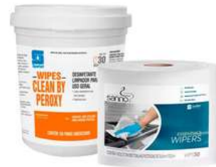
Panos umedecidos com limpador desinfetante a base de Peróxido de Hidrogênio