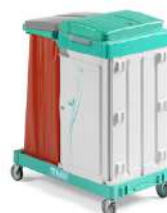
MAGIC LINE 470 S