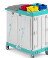
MAGIC LINE 300E