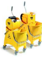
BALDE ESPREMEDOR WITTY