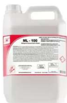
ML 100 Limpador Desincrustante