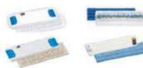
VELCRO SYSTEM Disponível em poliéster e microfibra