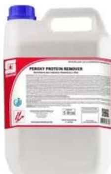
Peroxy Protein Remover Desinfetante e limpador à base de tensoativos e peróxido de hidrogênio desenvolvido para remover proteínas, gorduras e carboidratos