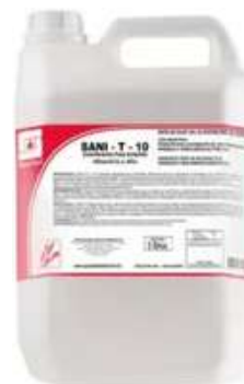
Sanit T 10 Desinfetante à Base de Quaternário de Amônio para área de processamento de alimentos